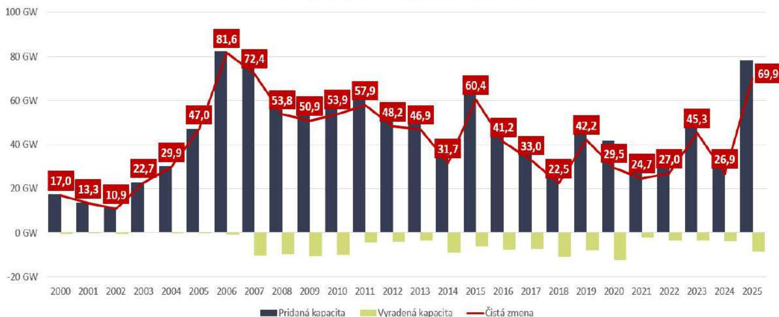
Koľko uhoľných kapacít v Číne pribudlo a koľko zaniklo?